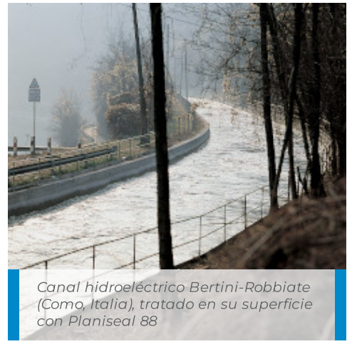
Canal hidroeléctrico Bertini-Robbiate (Como, Italia), tratado en su superficie con Planiseal 88